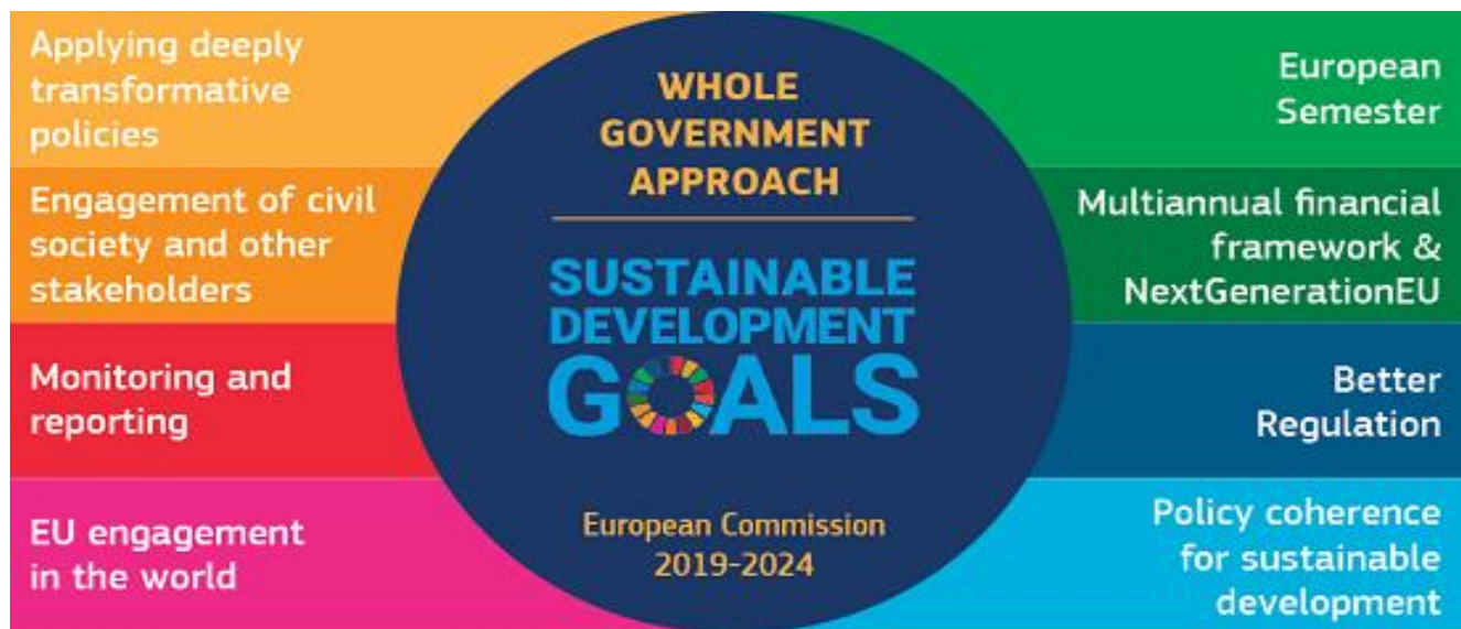
Илустрација 2. Илустрација Европске комисије о свеобухватном приступу ”Whole Government Approach” 924