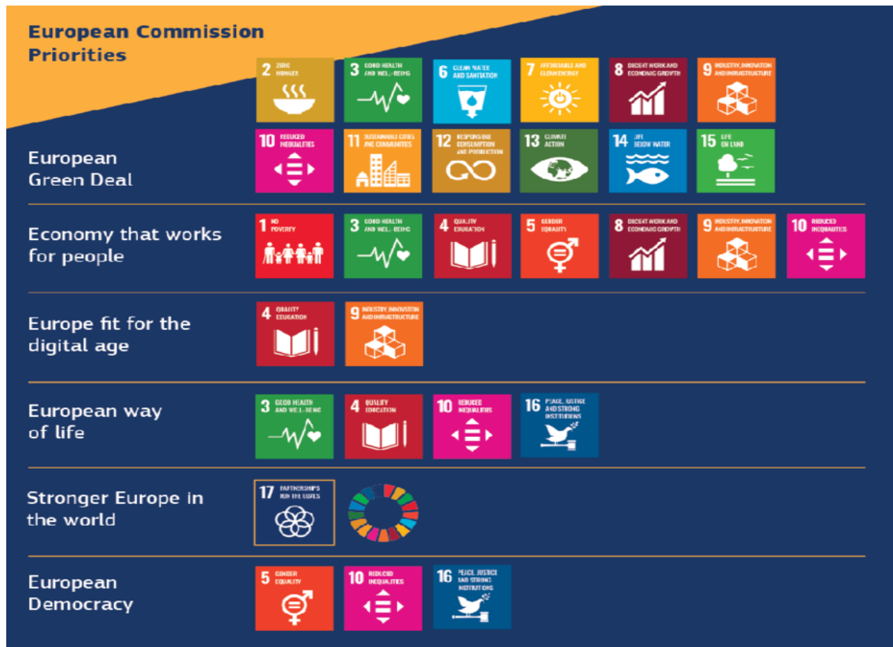
Илустрација 1. Приоритети Европске комисије 2019-2024. 919

ове ЕК описују се најчешће као трансформативни имајући у виду њихову природу која заиста изискује трансформације на више нивоа и прожимање више ЦОР по појединачним циљевима што је приказано и на званичној илустрацији ЕК на приказу испод. Поред наведеног Европског зеленог договора који обухвата дванаест Циљева одрживог развоја, трансформативни приоритети су и: економија у интересу грађана, Европа спремна за дигитално доба, промоција европског начина живота, снажнија Европа у свету, нови подстицај за европску демократију. 918 Кроз све наведене циљеве односно политичке приоритете тада именоване Председнице комисије, прожимају се Циљеви одрживог развија и настојање да Европска унија остане лидер у достизању одрживости.